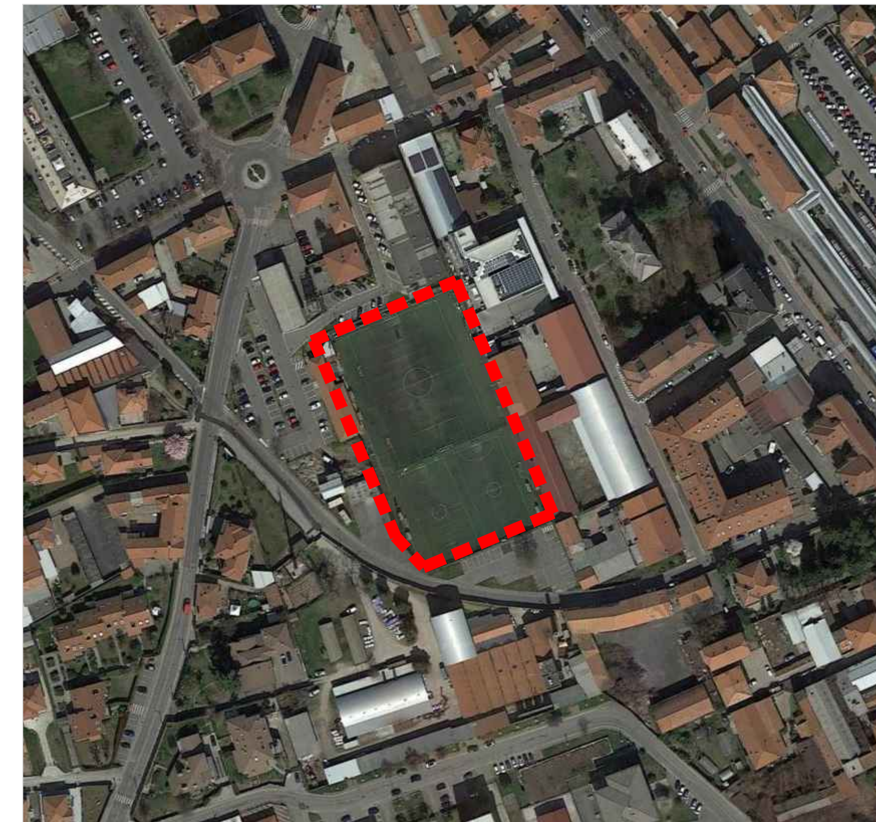
ORTOFOTO ESTRATTA DA GOOGLE MAPS